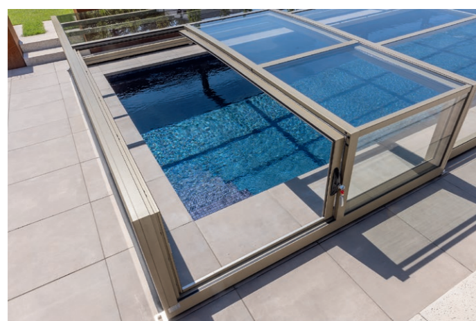
Durch die Seitenschiebetür der Überdachung wird ein komfortabler Einstieg in den Pool ermöglicht.

Polytherm GmbH | A-4675 Weibern | Pesendorf 10 Tel. +43 7732-3811 | office@polytherm.at www.polytherm.at