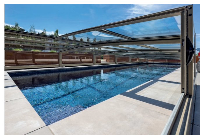
Die Überdachung aus echtem 2-Scheiben-VSG-Sicherheitsglas ist hagelsicher und unterschwimmbar.