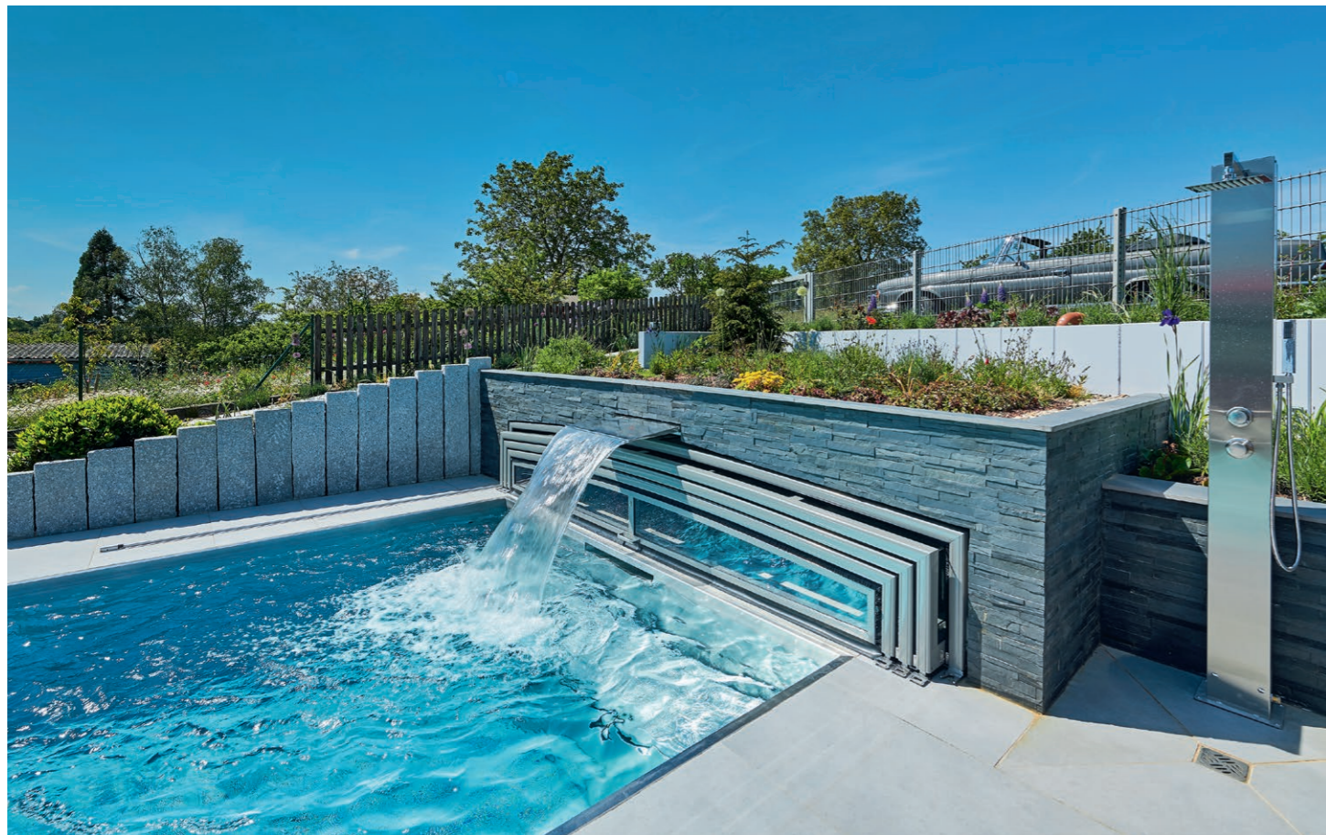
Garage mit Mehrfachnutzen: Ihr Dach ist bepflanzt. Und an der Vorderseite gibt es eine Schwalldusche (Bild oben), unter der man sich eine wohltuende Nackenmassage gönnen kann.