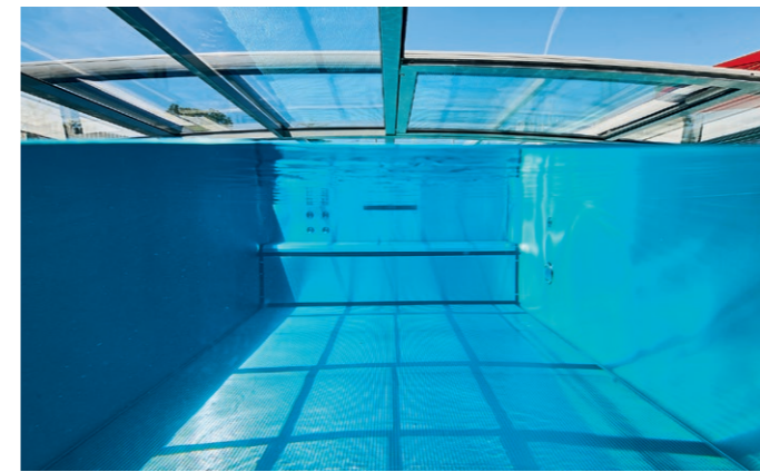
Das Unterwasserbild zeigt die Sitzbank an der garageseitigen Schmalseite des Pools. In der Bank wird die Rollladenabdeckung in eingefahrenem Zustand „geparkt“.

IN SCHÖNER, GRÜNER Lage befindet sich dieser Swimmingpool: umgeben von Feldern, Wiesen und Bäumen. Mit viel Natur drumherum, weitab von der Hektik des Alltags. Ein Ort, an dem man zur Ruhe kommen und die Geräusche der umgebenden Natur genießen kann: das Summen der Insekten im Hochsommer, das sanfte Rauschen der Bäume im Wind. Und wenn die Sonne scheint, so spannt sich ein ungetrübt blauer Himmel über dem Wasser des Schwimmbeckens, das dann auf unvergleichliche Weise zu strahlen und zu funkeln anfängt: Denn der Pool besteht aus dem hochwertigen Material Edelstahl, das seinen besonderen Zauber vor allem bei Sonneneinwirkung entfaltet. Die Bauherren wünschten sich nicht nur ein Becken zum Schwimmen. Auch der Spaßfaktor sollte nicht zu kurz kommen. Wellness für die Schwimmbadbenutzer sollte ebenfalls eine Rolle spielen. Neben diesen Faktoren waren auch Eigenschaften wie Sicherheit und Energieeffizienz wichtig. Deshalb hat das Schwimmbecken nicht nur eine Rollladenabdeckung, sondern auch eine Poolüberdachung aus echtem Sicherheitsglas. Sie halten die Wärme länger im Becken und schützen das Wasser vor Verunreinigungen.